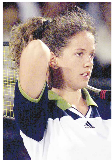
Dreht Patty Schnyder dem Team den Rücken zu?