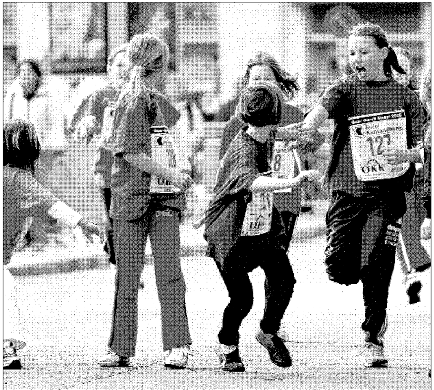
LAUFSPASS Nicht nur beim Nachwuchs treten Staffel-Teams aus völlig unterschiedlichen Sportvereinen gegeneinander an. ROLF DÜRER

In der Hauptrunde 1 geht es um die Qualifikation für die Playoff-Halbfinals.